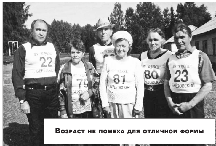
Возраст не помеха для отличной формы

моральным кладбищем шахтеров, погибших во время аварии 1995 года. Ходят на субботники по уборке городских улиц. Посещают лежачих больных из своей организации. Участвуют в спортивных соревнованиях. Зимой выставляли команду на «Лыжню России», а сейчас идет летняя спартакиада среди городских ветеранских организаций, где соревновались в турнирах по шахматам, шашкам, дартсу. Через несколько дней состо-