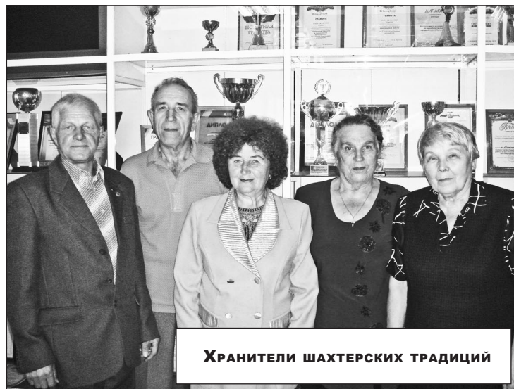
Хранители шахтерских традиций

Ветераны «Первомайской» живут не только воспоминаниями. У них много забот вполне реальных. Например, ухаживают за ме-