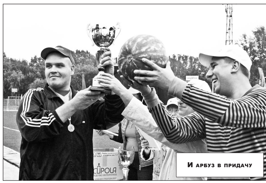
И арбуз в придачу

УЧРЕДИТЕЛЬ — ТРОФИМОВА Е. В. ГАЗЕТА ЗАРЕГИСТРИРОВАНА УПРАВЛЕНИЕМ ФЕДЕРАЛЬНОЙ СЛУЖБЫ ПО НАДЗОРУ В СФЕРЕ СВЯЗИ, ИНФОРМАЦИОННЫХ ТЕХНОЛОГИЙ И МАССОВЫХ КОММУНИКАЦИЙ ПТО КЕМЕРОВСКОЙ ОБЛАСТИ. СВИДЕТЕЛЬСТВО ПИ № ТУ 42-00167 ОТ 10.11.2009 Г. ВЫПУСК ПОДГОТОВЛЕН ПРЕСС-СЛУЖБОЙ ОАО «УГОЛЬНАЯ КОМПАНИЯ «СЕВЕРНЫЙ КУЗБАСС» РЕДАКТОР — ЕЛЕНА ТРОФИМОВА, ВЕРСТКА, ДИЗАЙН — ТАТЬЯНА ШЕПЕЛЬ-КУРОПТАТОВА АДРЕС РЕДАКЦИИ — 652427, КЕМЕРОВСКАЯ ОБЛАСТЬ, Г. БЕРЁЗОВСКИЙ, УЛ. МАТРОСОВА, 2, ОФ. 114. ТЕЛ. (384-45) 41-8-50. E-MAIL: TEV@KUZCOAL.RU WWW.KUZCOAL.RU