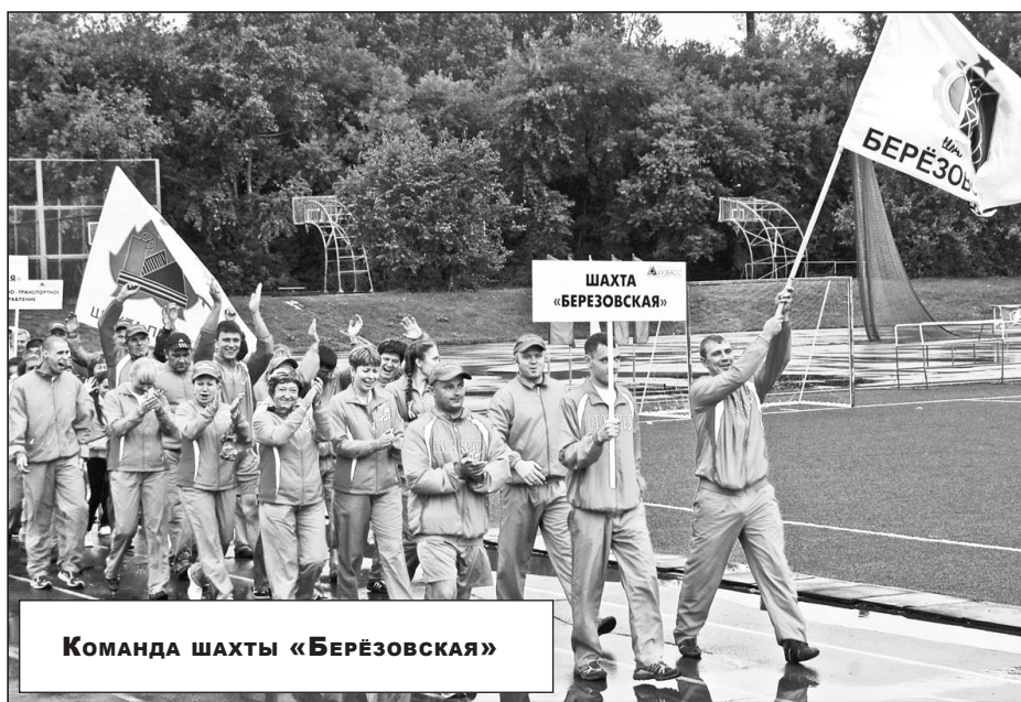
Команда шахты «Берёзовская»